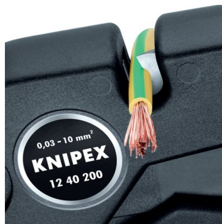
12 40 200: regulowany ogranicznik długości zdejmowanej izolacji